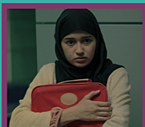
THE RED SUITCASE de Cyrus Neshvad