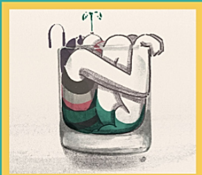
TÊTE DE LINOTTE de Gaspar Chabaud